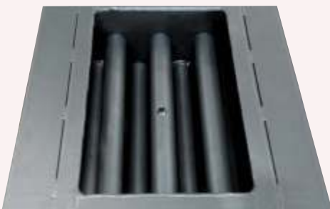
Tripla fascio tubiero