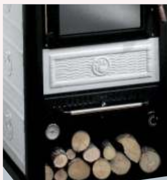
Dettaglio centralina comandi Detail of the central switch system