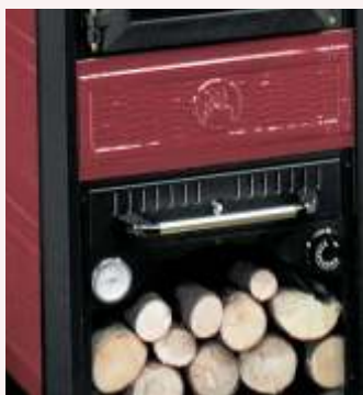
Dettaglio centralina comandi Detail central switch system