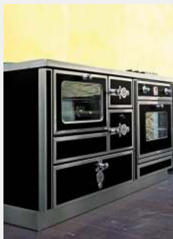
A richiesta piano cottura filtop e forno elettrico in coordinato.