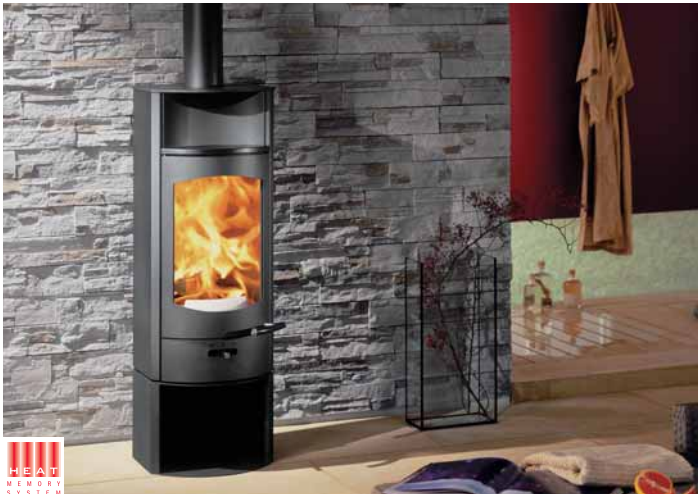
Flok avec socle