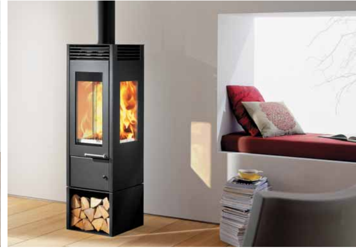
Glass avec socle