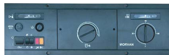
Tableau DFX ECS