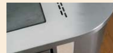
Dettaglio top sagomato Details of a moulded top