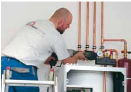
Terminer le montage et fermer l'appareil.