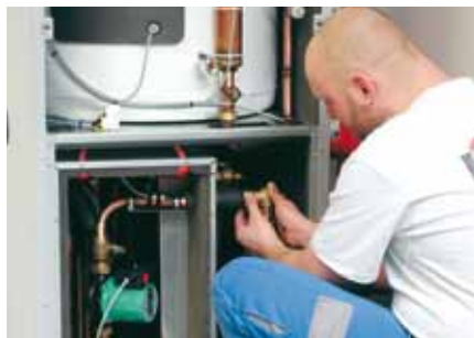
Raccorder la modulbox.