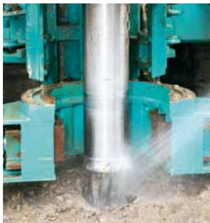
Forage pour la sonde géothermique