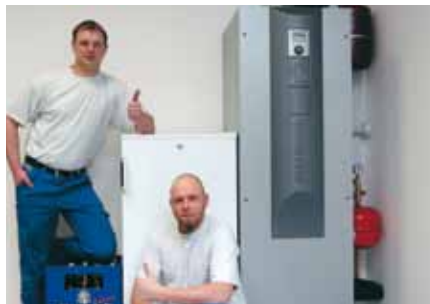
Et voilà, c'est aussi simple que cela.