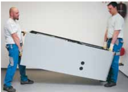
Transport plus aisé grâce à la modulbox extractible.

normes Alpha-InnoTec permet un gain de temps et d'argent pour nos clients. Oubliés les frais de travaux supplémentaires complexes. L'installation d'une pompe à chaleur ne prend qu'une à deux heures, si les accords sont correctement réalisés.