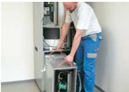
Encastrer la modulbox dans l'appareil.