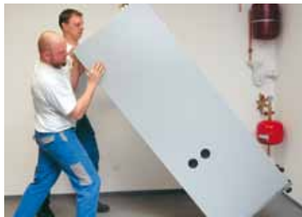
Basculer la pompe à chaleur et la poser à sa place.